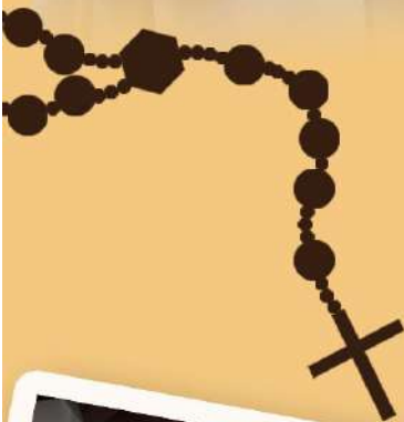
สังฆานุกรนิโกลาส วีรภัทร คูหาจิต